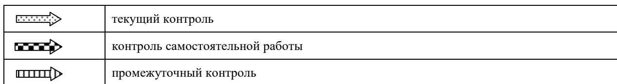
Рисунок 1 - Рейтинговая система оценки знаний

При пропуске рубежного контроля знаний (модуля) без уважительной причины студент допускается к сессии только после ликвидации задолженности . При этом полученная оценка в зачёт балльно-рейтинговой аттестации идёт с понижающим коэффициентом.