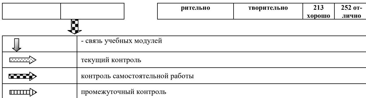
Рисунок 5 - Рейтинговая система оценки знаний

Текущая аттестация проводится на каждом аудиторном занятии. Формы и методы текущего контроля: устное выборочное собеседование, письменные фронтальные опросы, проверка и оценка выполнения практических заданий и др. При изучении каждого модуля дисциплины проводится текущий контроль знаний с целью проверки и коррекции хода освоения теоретического материала и практических умений и навыков. Текущий контроль знаний проводится по графику в часы практических (семинарских) занятий по основному расписанию, либо в дополнительное время при проведении компьютерного тестирования. После сдачи модуля (текущего контроля знаний) в журнале академической группы выставляется рейтинг студента в баллах. Модуль считается сданным, если студент получил не менее 50% баллов от максимально возможного количества, которое мог бы получить за этот модуль. Если студент не прошел текущий контроль знаний (не сдал модуль), то продолжает учиться и имеет право сдавать следующий модуль по этой дисциплине. В случае пропуска текущего контроля знаний (модуля) по уважительной причине студент допускается к его прохождению по согласованию с преподавателем и при предоставлении в деканат оправдательного документа для получения допуска.