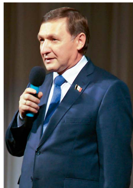
Председатель Государственного Совета УР В.П. Невоструев