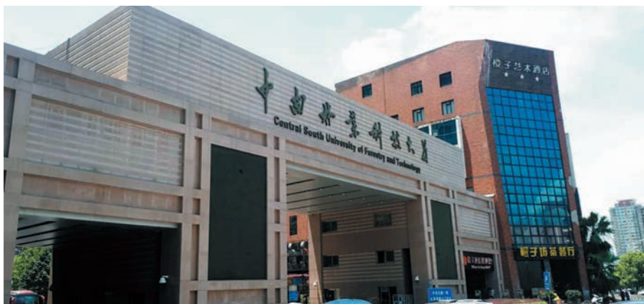
Центральный Южный Университет Технологий Китая стал домом для делегации на время форума.