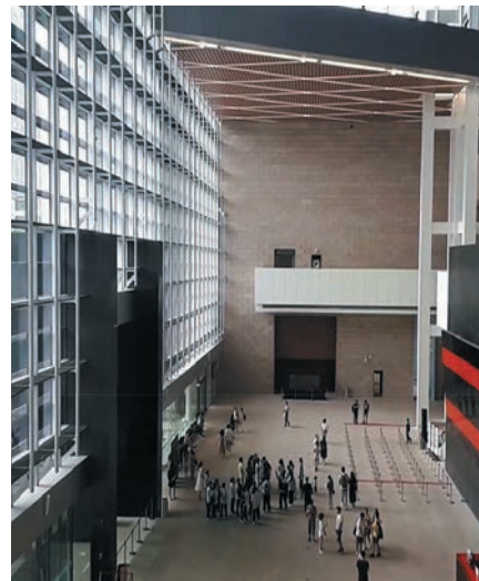
Холл музея провинции Хунань.

Хотелось бы сказать пару слов относительно общения. Большинство участников форума, как с китайской, так и с российской стороны, неплохо знали английский язык, так что основная доля наших разговоров проходила именно на английском. Самое первое время было стеснительно и даже страшно начать диалог, во-первых, с иностранцем, во-вторых, на английском языке. Причем те же самые эмоции и чувства испытывали китайцы, поэтому, сообразив, что все мы немного боимся друг друга, потихоньку мы начали делать первые шаги навстречу, и уже на четвертый-пятый день нас невозможно было оторвать от беседы. Правда, когда ни один из участников разговора не помнил нужного слова по-английски, начиналось самое интересное – в дело шло все: и жесты, и позы, и звуки, русские выкрикивали варианты по-русски, китайцы – по-китайски, одним словом, начиналась игра в «крокодила». В конечном счете, кто-то вспоминал про переводчика, и беседа продолжалась. Хочется отметить, что с переводом на русский язык было не все гладко. Перед каждой экскурсией нам выдавались распечатки, где содержалась информация о предстоящей экскурсии, но зачастую по-